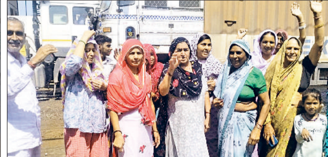
भिवानी। डाबर कॉलोनी इलाके में सीवर के ओवरफ्लो होने से सड़कों पर फेला पानी व बढहाल सीवरेज के विरोध में नारेबाजी करती महिलाएं।