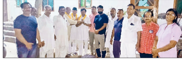
भिवानी। नवनिर्वात पदाधिकारियों को सम्मानित करते हुए।

लड़कियों का दबदा कायम रहा। टीम के अटैक और डिफेंस में शानदार तालमेल देखने को मिला, जिसकी बदौलत उन्होंने दिल्ली की टीम को वापसी का मौका नहीं दिया।