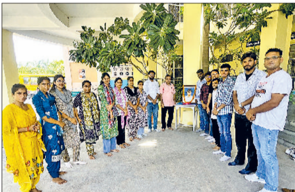
भिवानी। शहीद भगत सिंह को श्रद्धांजलि देते शिक्षक व विद्यार्थी।