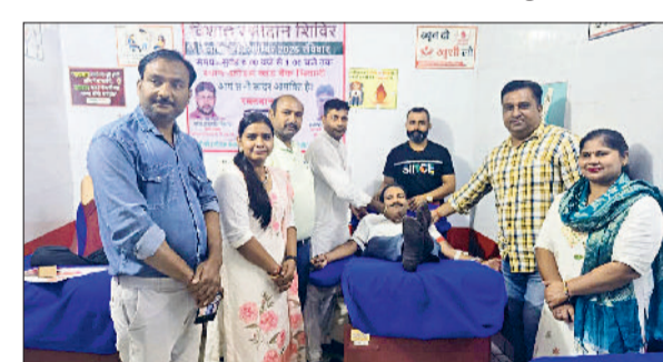
भिवानी। रक्तदाताओं को बैज लगाकर सम्मानित करते झांसी की रानी प्रेरणा समूह एवं भारतीय प्रजापति हिरोज आर्गनाइजेशन के सदस्य।