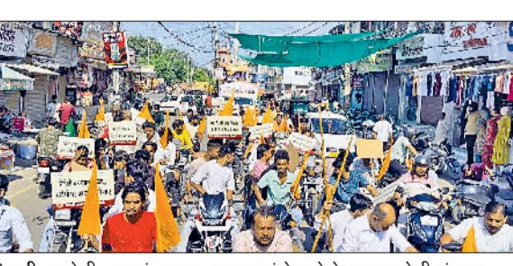
भिवानी। स्वदेशी अपनाए-समृद्ध भारत बनाए के नारे के साथ स्वदेशी संकल्प यात्रा निकालते शहरवासी।