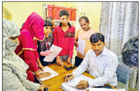
भिवानी। कैंप में महिलाओं के दस्तावेज पूर्ण करते हुए।