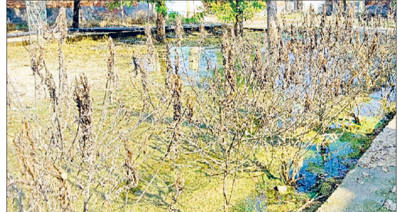
भिवानी। स्कूल परिसर में सुखाने के लिए रखी गई भीगी हुई फितबें, स्कूली कमरों से पानी के साथ बह कर आया रिकार्ड व अन्य कागजात और यादा पानी जमा होने से सूखे हरे पेड़ों का दृश्य।