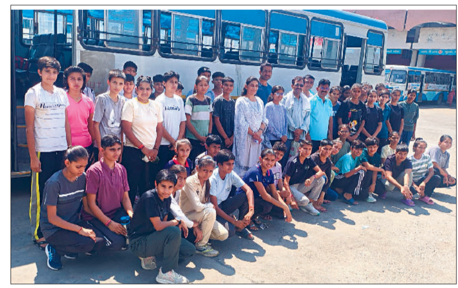
भिवानी। राज्य स्तरीय स्कूली खेल प्रतियोगिता के रवाना होते भिवानी के शारीरिक शिक्षक व एथलेटिक्स टीम।