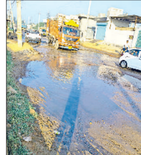
भिवानी। डाबर कॉलोनी इलाके में सीवर के ओवरफ्लो होने से सड़कों पर फेला पानी व बढहाल सीवरेज के विरोध में नारेबाजी करती महिलाएं।