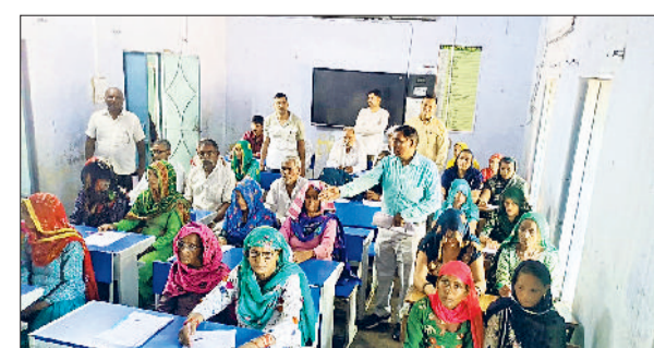
बवानीखेड़ा। उल्लास परीक्षा में भाग लेते परीक्षार्थी।