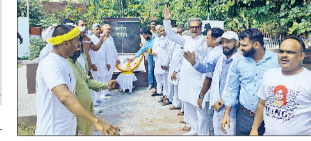
तोशा। शहीद भगत सिंह के चित्र पर पुष्प अर्पित करते हुए।